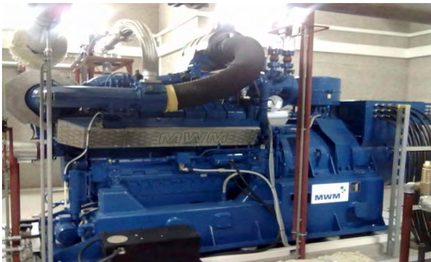
Silniki gazowy o mocy 600 kW