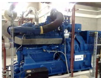
silnik kogeneracyjny firmy Deutz