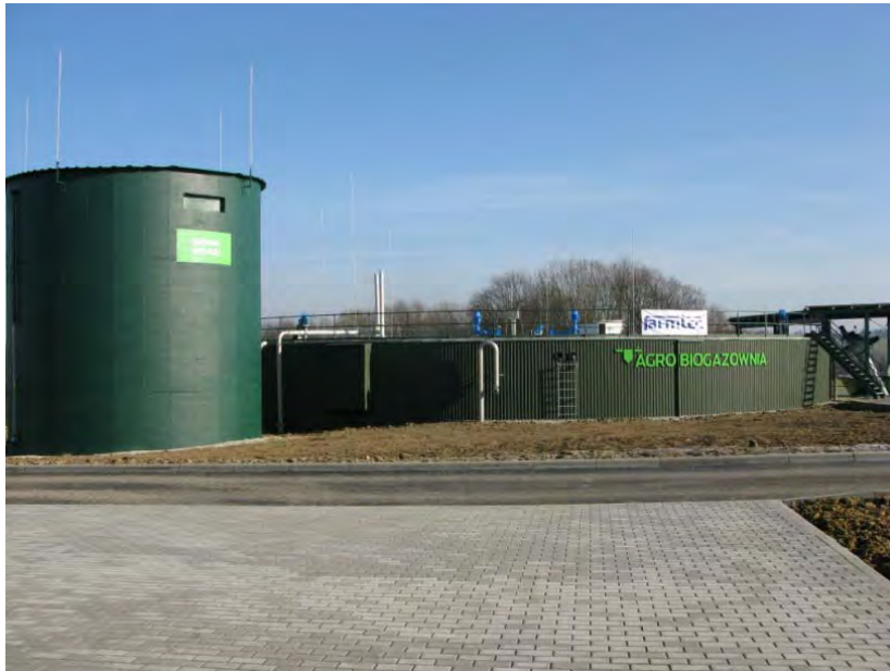
z lewej zbiornik biogazu, w głębi reaktor fermentacyjny