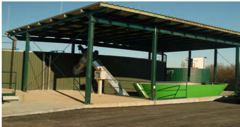
Dozownik substratu stałego